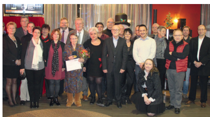
Le 2 décembre, lors de la cérémonie.

Nous les remercions pour le remarquable travail qu'ils ont accompli, permettant à la Fraternelle de poursuivre son rôle de mutuelle de proximité, de rester indépendante, performante et efficace en conservant l'esprit de solidarité et respectant les valeurs mutualistes.